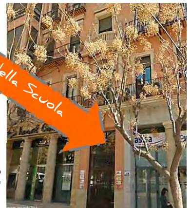
Entrata della Scuola