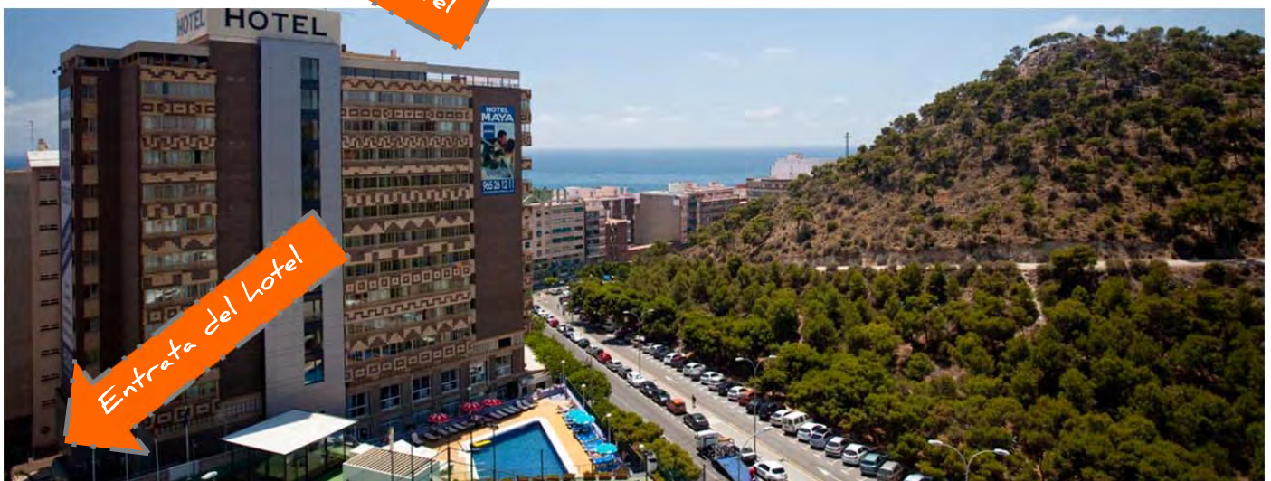
Entrata del hotel