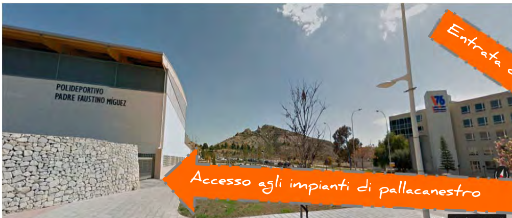
Accesso agli impianti di pallacanestro